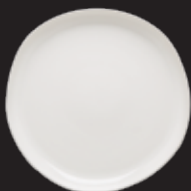
PRATO RASO 28 DINNER PLATE 28 FF0530500000