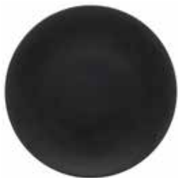
PRATO MARCADOR 32 CHARGER PLATE 32 FF0230570000