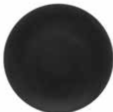
PRATO RASO 27 DINNER PLATE 27 FF0010570000