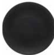
PRATO SOBREMESA 21 DESSERT PLATE 21 FF0020570000