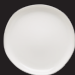
PRATO SOBREMESA 22 DESSERT PLATE 22 FF0540500000