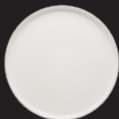
PRATO RASO 28 DINNER PLATE 28